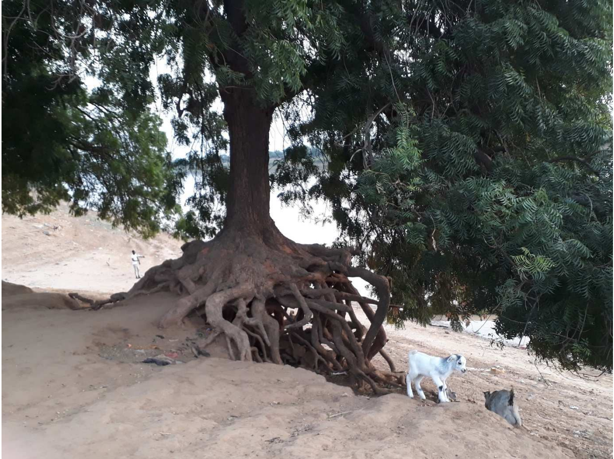
Tokomadji, berge convexe sapée en permanence par le fleuve Sénégal