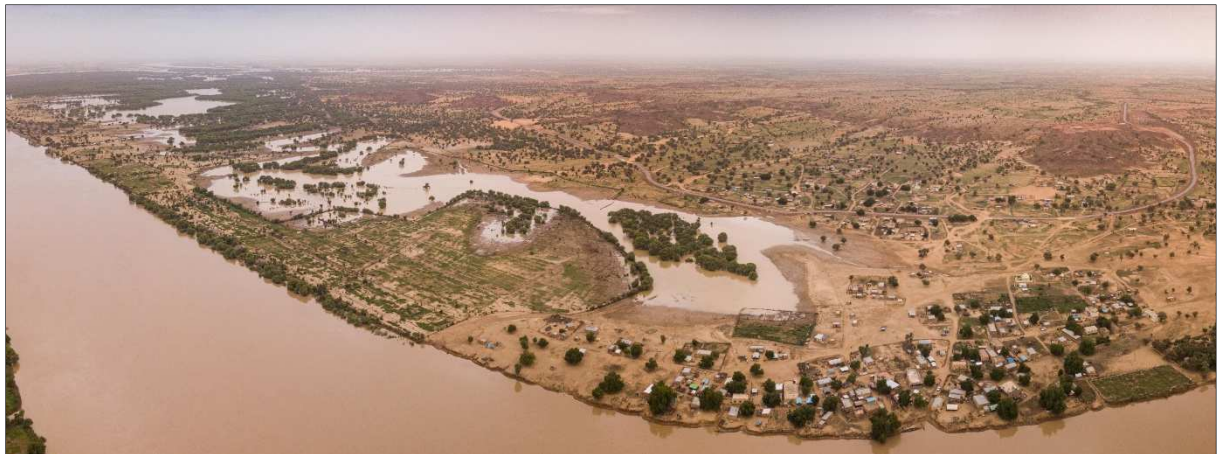
Le village de Tokomadji sur la berge convexe d'un méandre du fleuve Sénégal.